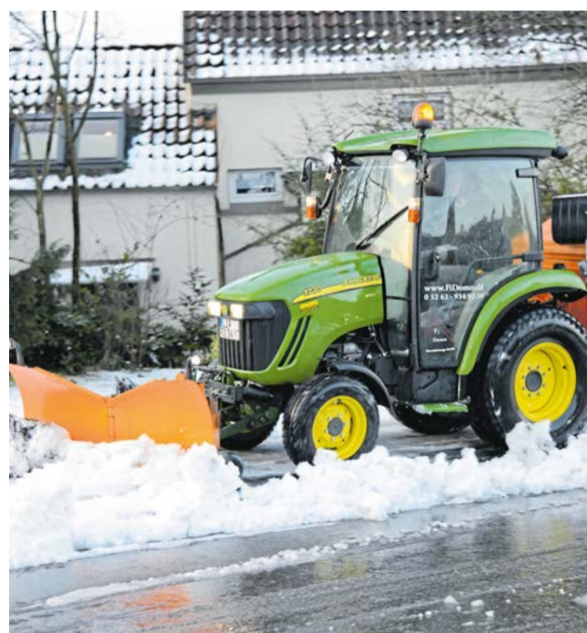
Winter wie Sommer ist der eigene Hausmeisterdienst im Einsatz. Das Serviceangebot reicht vom Schneeräumen bis hin zu Reparaturen und Grundstückspflege.

Mittlerweile werden ca. 700 Wohneinheiten in Lippe und darüber hinaus verwaltet. „Wir haben unsere Kapazitätsgrenze erreicht“, verrät Wolfgang Kespohl, dass aktuell keine neuen Anfragen bedient werden können.