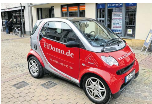
Mit diesem kleinen Firmenflitzer fährt das FiDomo-Team zu Kunden in ganz Lippe und darüber hinaus.

Im Jahr 2020 hat der Unternehmer kräftig in ein modernes EDV-System investiert, um eine geschützte Online-Kommuni-