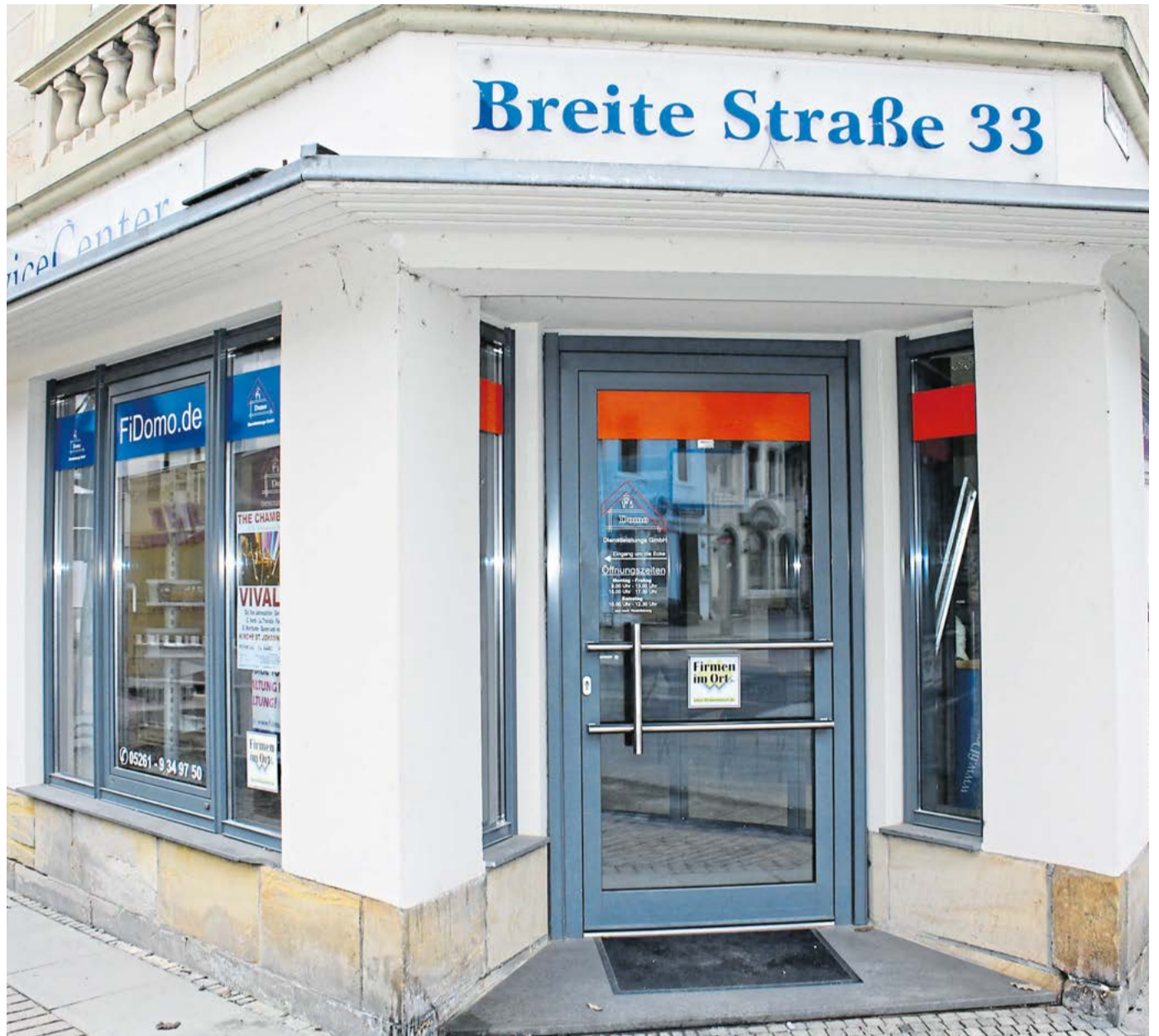
Im Obergeschoss des ehemaligen Schuhhauses Sauerländer an der Breiten Straße befindet sich der FiDomo-Firmensitz. Schwerpunkte sind Hausverwaltung, Heizkostenabrechnungen, Hausmeisterservice, Vermietung und Verpachtung.